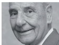
1969 Washington Cañas Lastarria