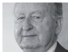
1970 Helios Piquer Meliga